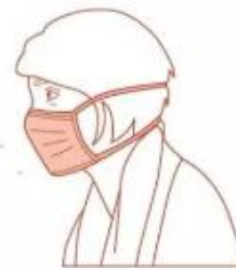
Avec masque chirurgical