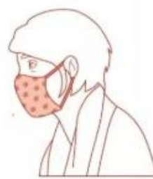
Avec masque en tissu catégorie 2