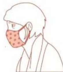
Avec masque en tissu catégorie 2