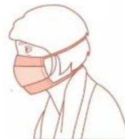
Avec masque en tissu catégorie 1, « fait maison » ou acheté dans le commerce, réservé aux professionnels en contact avec le public