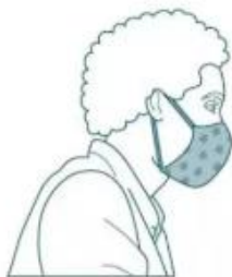
Avec masque en tissu catégorie 2