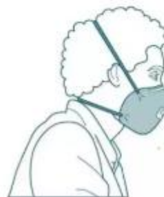
Personne bien portante avec masque FFP2