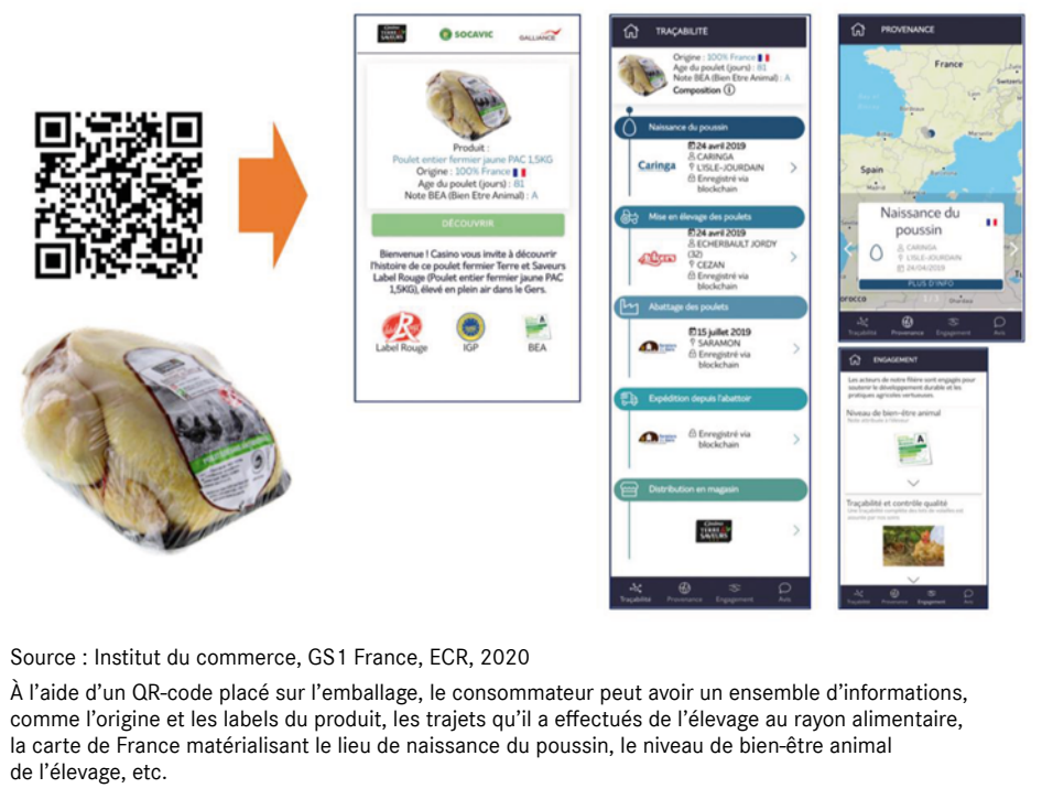
Figure 3 - Exemple de la numérisation de la traçabilité d'un poulet